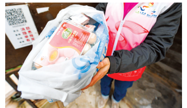
真光新村第一社区居委会党总支书记向菁薇为居家隔离的居民送菜上门。