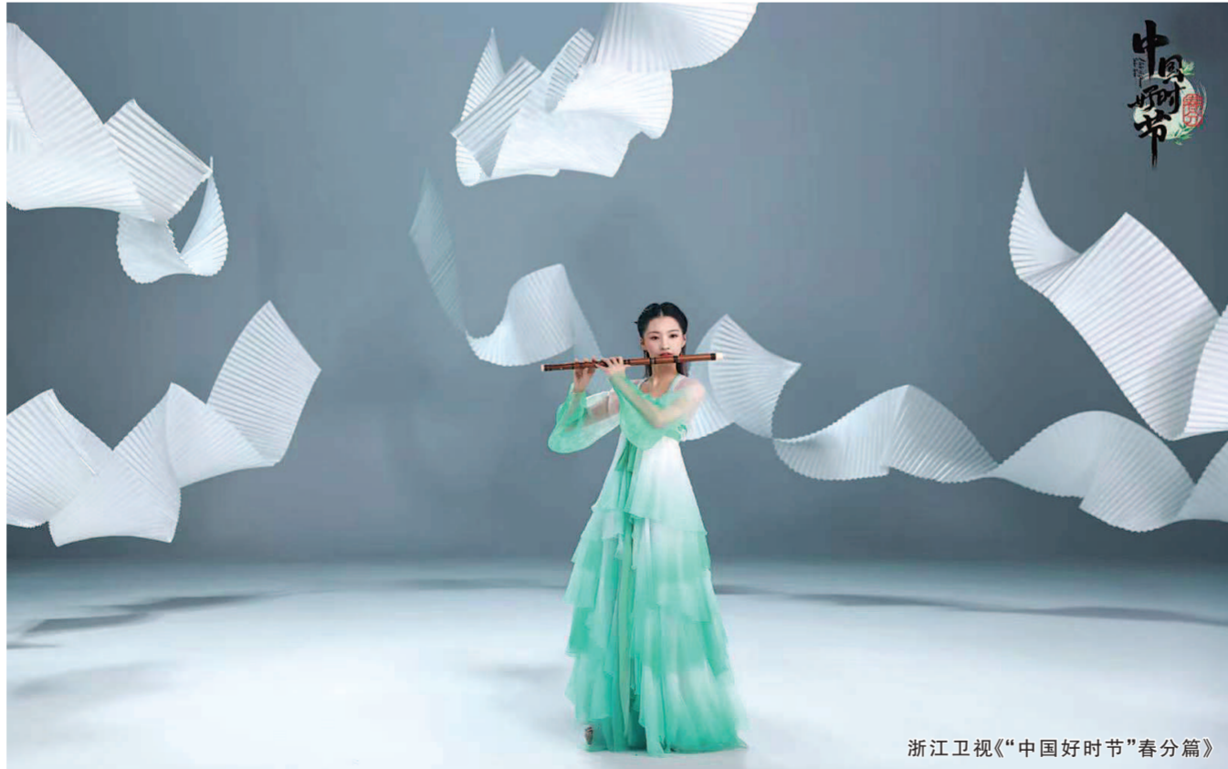
浙江卫视《“中国好时节”春分篇》

在康震看来,被时代诗情滋养着的少年人、以传统文化扬国之气节的少年人,“也是一个民族、一个国家不断走向进步的非常鲜明的标识”。