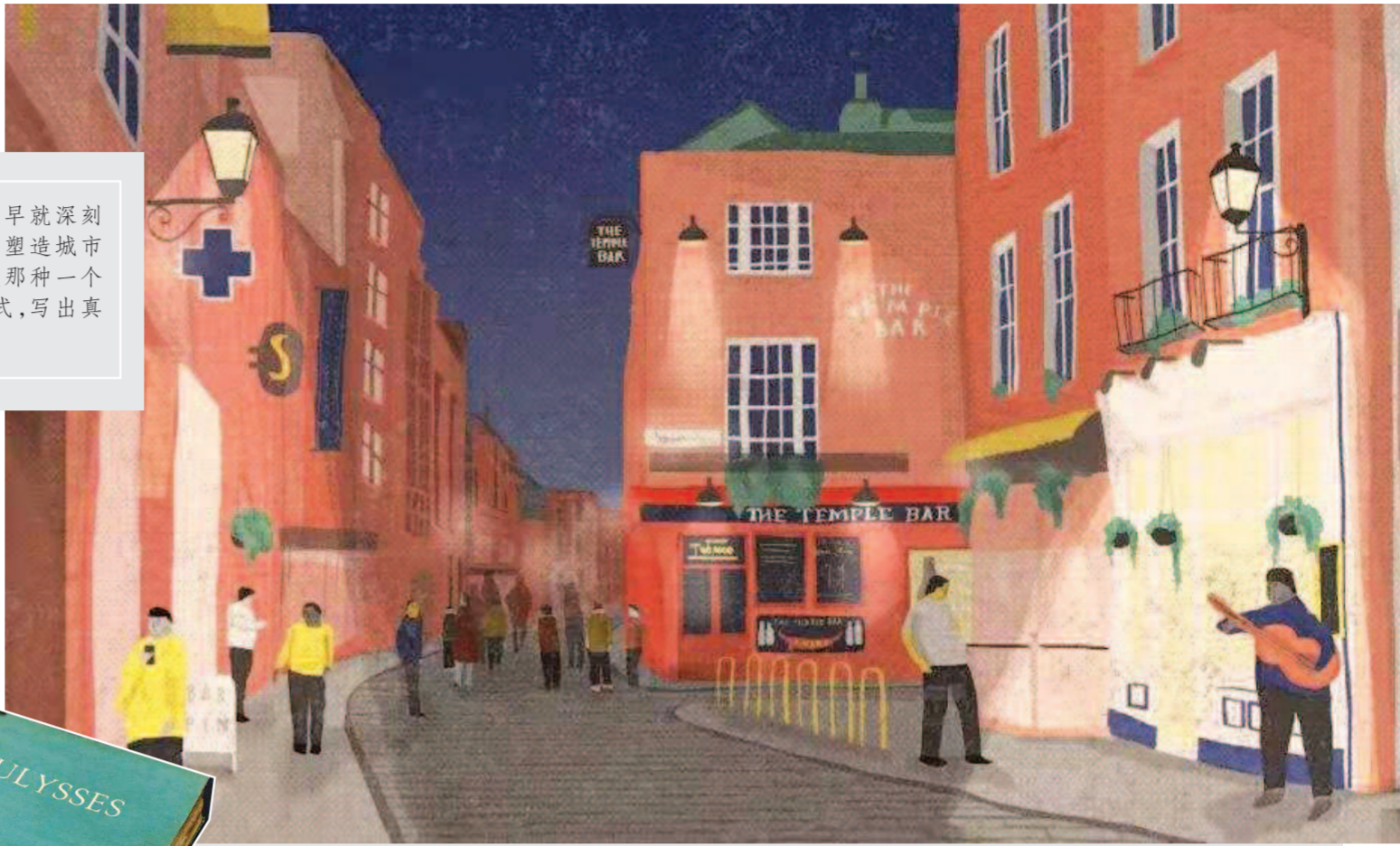
▲《尤利西斯》无疑有资格夸口用文学的语言塑造了一座城市，用乔伊斯自己的话说，如果都柏林城被摧毁，人们完全可以按照他的小说重建一个都柏林。图为《尤利西斯》插图，展现书中描绘的都柏林街景

与这形成鲜明比照的是它在阅读上的难度，有评论说“一般智者的读者可能从中一无所获”。其实，早在《尤利西斯》出版同年，就有人预言，“100个男人、女人中没有10个能读完《尤利西斯》”。