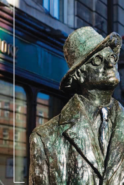
▲乔伊斯笔下的都柏林是有生命的。从第四章作者的笔触由城郊进入到都柏林市区起，各章就分别对应肾、生殖器、心脏、肺、食道、大脑等等不同的人体器官。图为都柏林的乔伊斯像