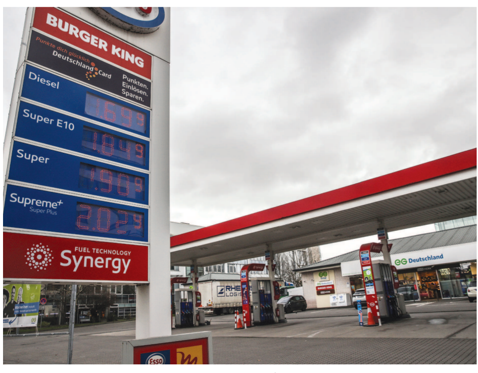
2月25日在德国法兰克福拍摄的一家加油站屏幕上显示的油品价格。

随着乌克兰局势骤然升级，欧洲股票、外汇、大宗商品等市场24日大幅震荡，油气市场价格更是出现巨幅波动。 数据显示，当天伦敦布伦特原油期货价格盘中一度突破每桶105美元，创下7年多来新高。被视为欧洲天然气基准价格的荷兰所有权转让中心（TTF）近月天然气价格当天上涨33%，英国天然气期货价格涨幅超过35%。 英国国家经济社会研究院首席经济学家毛旭新在接受新华社记者采访时表示，俄乌局势突然升级令市场措手不及，局势紧张程度超出预期，这种不确定性带来的风险导致油气价格上升。 市场研究机构凯投宏观全球经济团队的报告指出，俄罗斯在全球能源供应中的关键作用不容低估，欧盟进口天然气中约40%、进口原油中约30%来自俄罗斯，大宗商品市场已经开始对俄罗斯对西方能源出口中断的风险进行定价。报告认为，能源价格的风险溢价将在一段时间内保持高位。 中银国际发布报告说，在极端情况下，德国和东欧国家可能出于能源安全考虑而大量采购天然气现货，进一步加剧欧洲天然气供应紧张状况，TTF价格或将突破历史最高点。报告认为，在原油方面，一旦俄罗斯对欧 洲原油出口受到影响，市场很难找到替代品，将出现供应十分紧张的局面。在这种情况下，预计布伦特原油期货价格有望突破每桶120美元。 期货市场价格上涨效应已经传导至消费者。英国汽车服务公司RAC的数据显示，英国汽油、柴油的平均价格都已经涨至每升约1.5英镑的历史最高水平。 该公司发言人西蒙·威廉姆斯说，成品油价格上升到每升1.55英镑带来的风险“非常现实”，许多依赖汽车工作和生活的人将面临严重经济困难。 万神宏观经济学研究公司英国首席经济学家塞缪尔·图姆斯表示，如果能源价格保持如此高水平，经济将会停滞不前。“本周能源价格飙升如果持续下去，将使英国消费者价格指数（CPI）上升1.5个百分点，家庭实际可支配收入今年将下降约2.2%，为二战以来最大降幅。” 毛旭新认为，一旦“北溪-2”天然气管道项目不能继续推进，能源价格上涨几乎不可避免。能源价格如果维持当前水平，将推动欧洲CPI至少上涨1%。 新华社记者 杨海若 黄泽民 赵修知（新华社伦敦2月24日电）