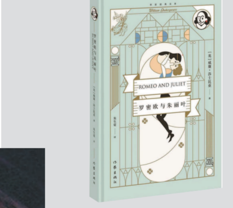
▲《罗密欧与朱丽叶》 [英]莎士比亚 著 朱生豪 译 作家出版社出版