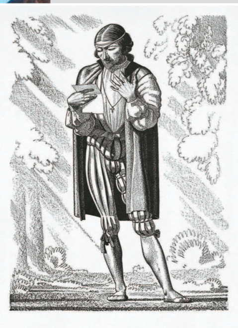
▲美国版画艺术家罗克韦尔·肯特创作的莎士比亚戏剧插图