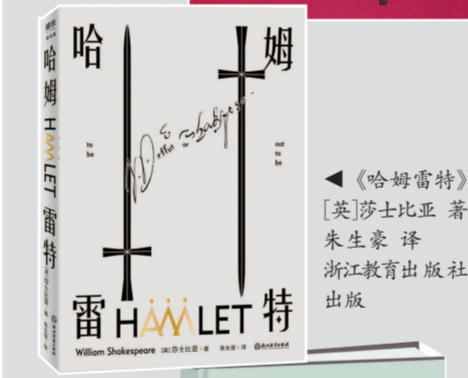
▲《哈姆雷特》 [英]莎士比亚 著 朱生豪 译 浙江教育出版社 出版