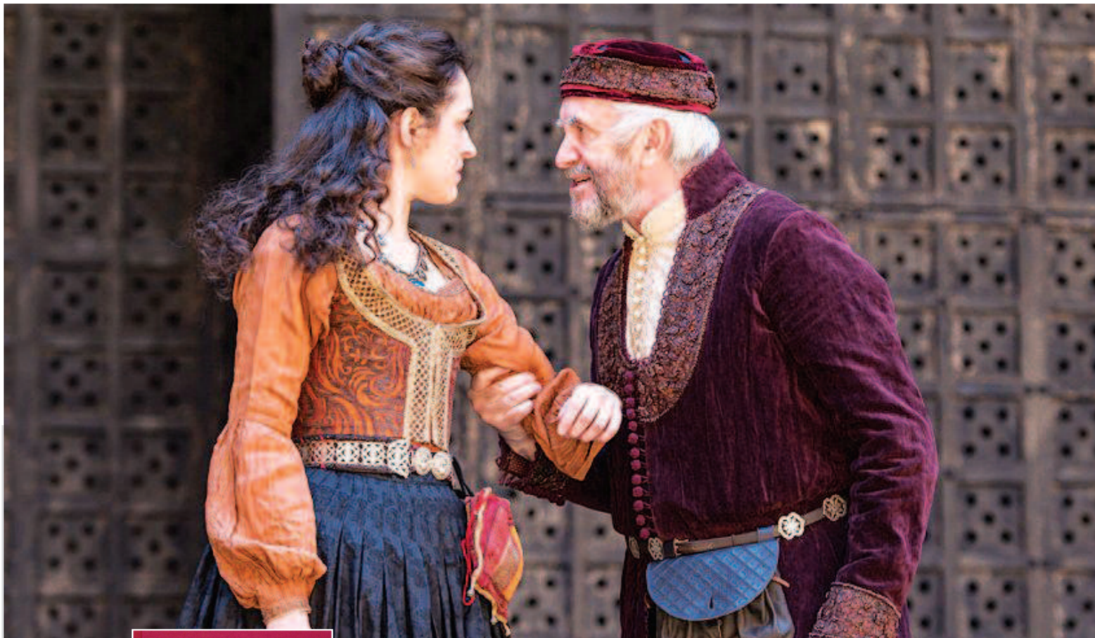
▲图为乔纳森·普雷斯(右)在莎士比亚环球剧院内演出《威尼斯商人》

剧中有一段女主角鲍西娅讽刺英国男爵穿着不伦不类的衣服：“他的紧身衣是在意大利买的，他的裤子是在法兰西买的，他的软帽是在德意志买的，至于他的行为举止，那是从四面八方学来的”（一幕二场）。淡淡几笔，一个开拓了市场、游历了欧亚大陆的新兴资产阶级的形象跃然而出。另外，印度的香料、东方的绸缎罗罗，在剧本中随处可见。剧本先是借用夏洛克的口（一幕三场），后来又通过巴萨尼奥（三幕二场），提到安东尼奥的商船在世界各处港口停留：墨西哥、热那亚、的黎波里、里斯本、西印度群岛、英格兰。在这个作品中我们处处可以感受到一个大变革的时代的气息。