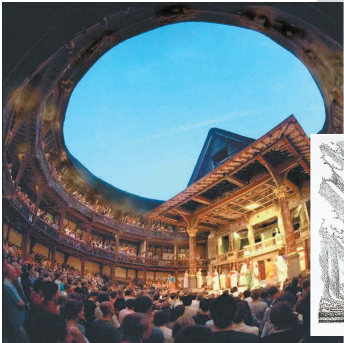
▲莎士比亚的戏剧常常会带给我们一种户外感。在《威尼斯商人》里也同样，剧本为我们讲述了一个意大利青年巴萨尼奥追求富家女鲍西娅的爱情故事，并由此牵出犹太高利贷者与威尼斯商人安东尼奥之间“一磅肉的债务”的故事。在这个剧本里，剧中人物不经意地会谈到沙滩、礁石、帆船、桅杆、沙漏、季风等等。图为莎士比亚环球剧院内部