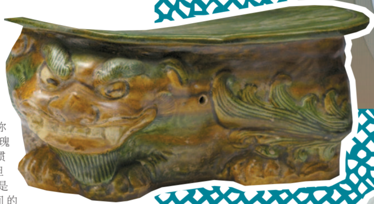
► 北宋景德镇青白釉狮形枕