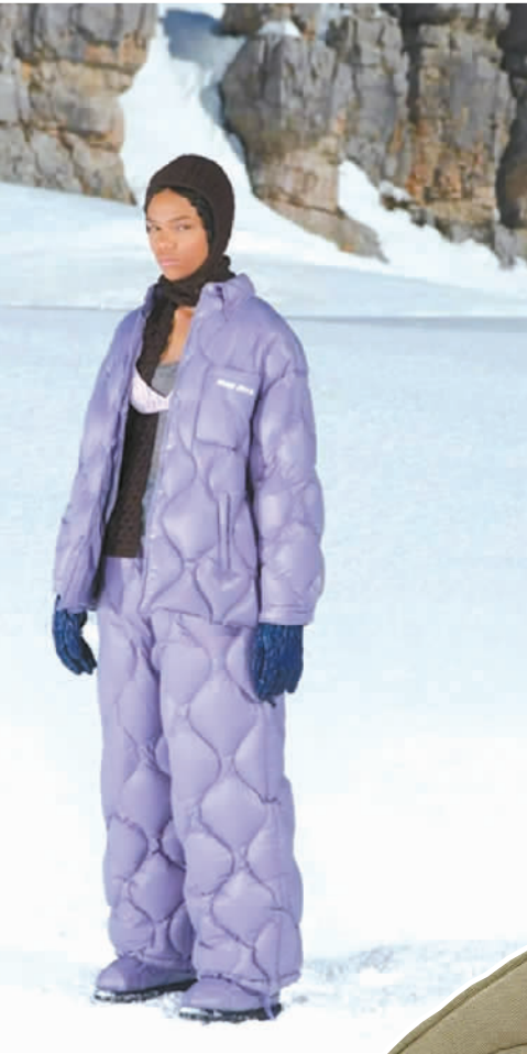
▲ 2021秋冬巴黎时装周上,缪缪秋冬线上大秀的秀场选在壮阔的高山雪地,并且反复运用改良版巴拉克拉法帽增加了整体造型的氛围感。