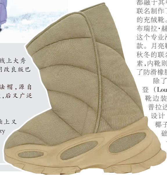
▲ 香奈儿滑雪主题大秀。 ▼ 这个冬季,很多品牌在丑鞋的基础上又推出了新款雪地靴,图为Adidas Yeezy Nstdt Boot。