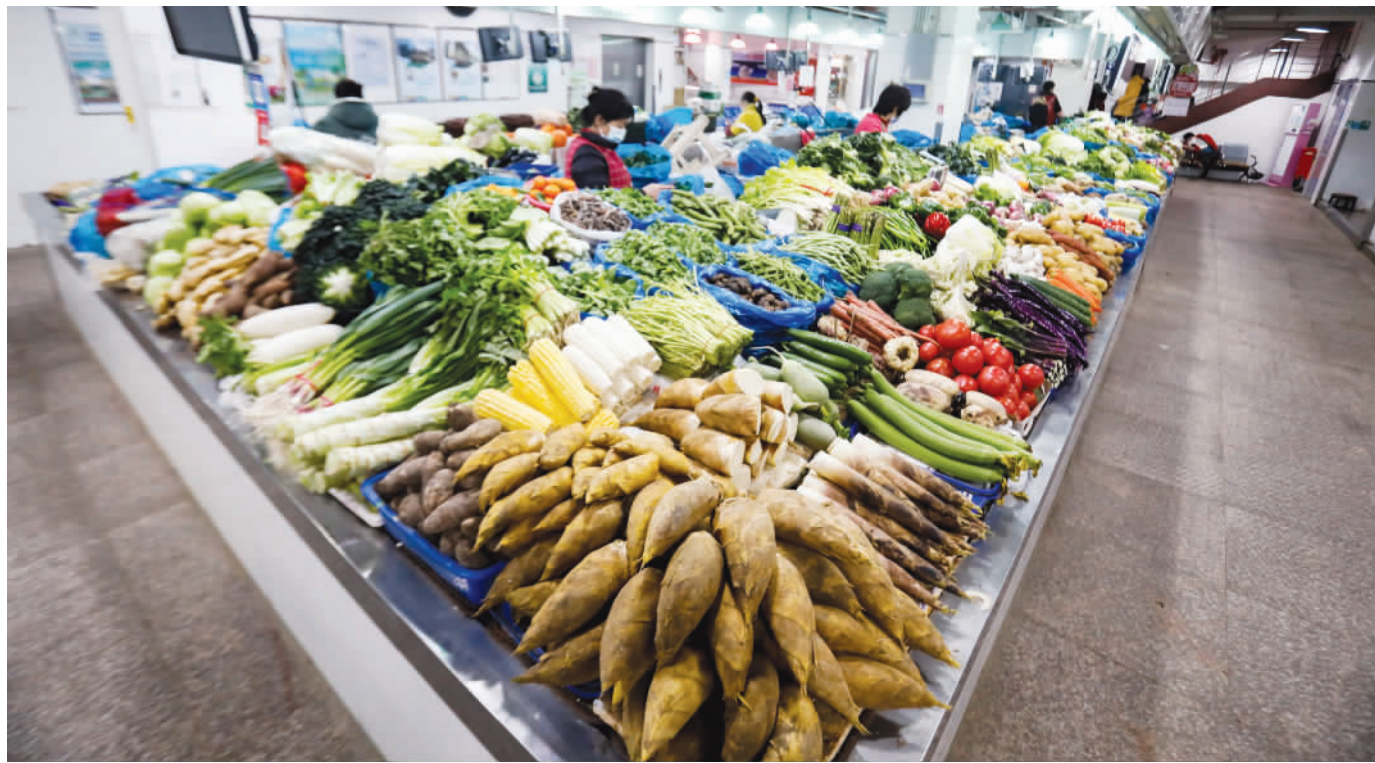
沪上菜场各类蔬菜供应充足。

长宁区美天副食品公司下辖20个菜场，今年号召营业员主们留沪过年。相关负责人介绍，菜市场内95%的经营业主今年都不回家过年，全力保障春节期间老百姓菜篮子“拎得稳”。遍布大街小巷的超市也准备好了。联华股份总经理、执行董事种晓兵告诉记者，联华蔬菜的采购基地遍布全国，其中，来自山东和崇明基地直采的蔬菜占比大约40%。为了保障供应，这些基地的采购量在原来基础上均增加了2至3倍，尤其是大白菜的供货量，原先每天采购10吨左右，目前每天准备50—60吨，预计整个春节假期的供应量在500吨以上。