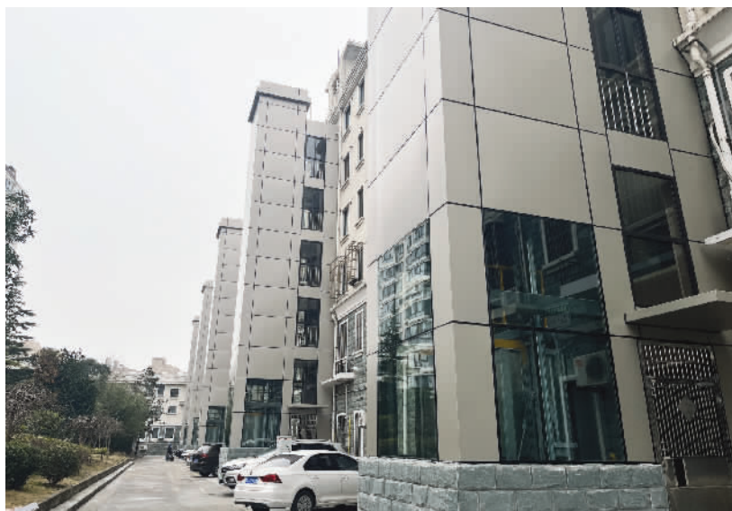
明光苑小区5台加装电梯提前完工，让居民们实现了期盼已久的电梯梦。

施工单位在破土动工后发现，小区地下横七竖八排列着各种塑料管道，管线搬迁任务量非常大。为了不耽误工程进度，川沙新镇城建中心当即主动出击，与水、电、燃气、通信等相关公司取得联系，一家家沟通协