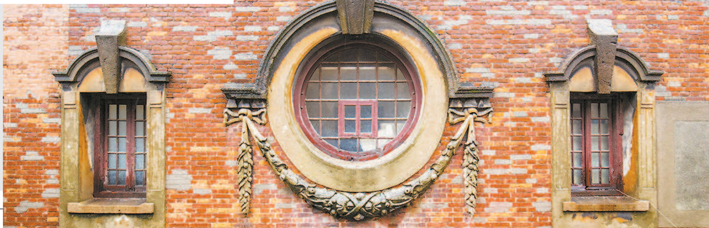
▲ 张园77号有着西方古典风格的水刷石半圆形窗眉与圆窗