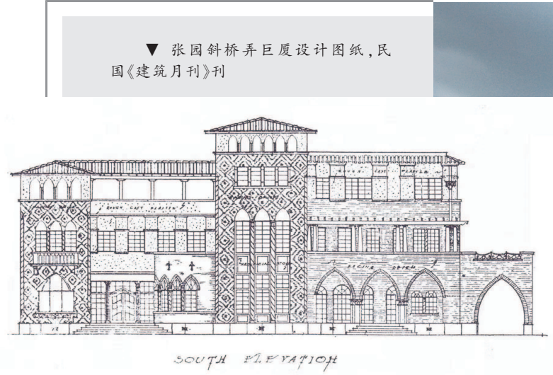
▼ 张园斜桥弄巨厦设计图纸，民国《建筑月刊》刊