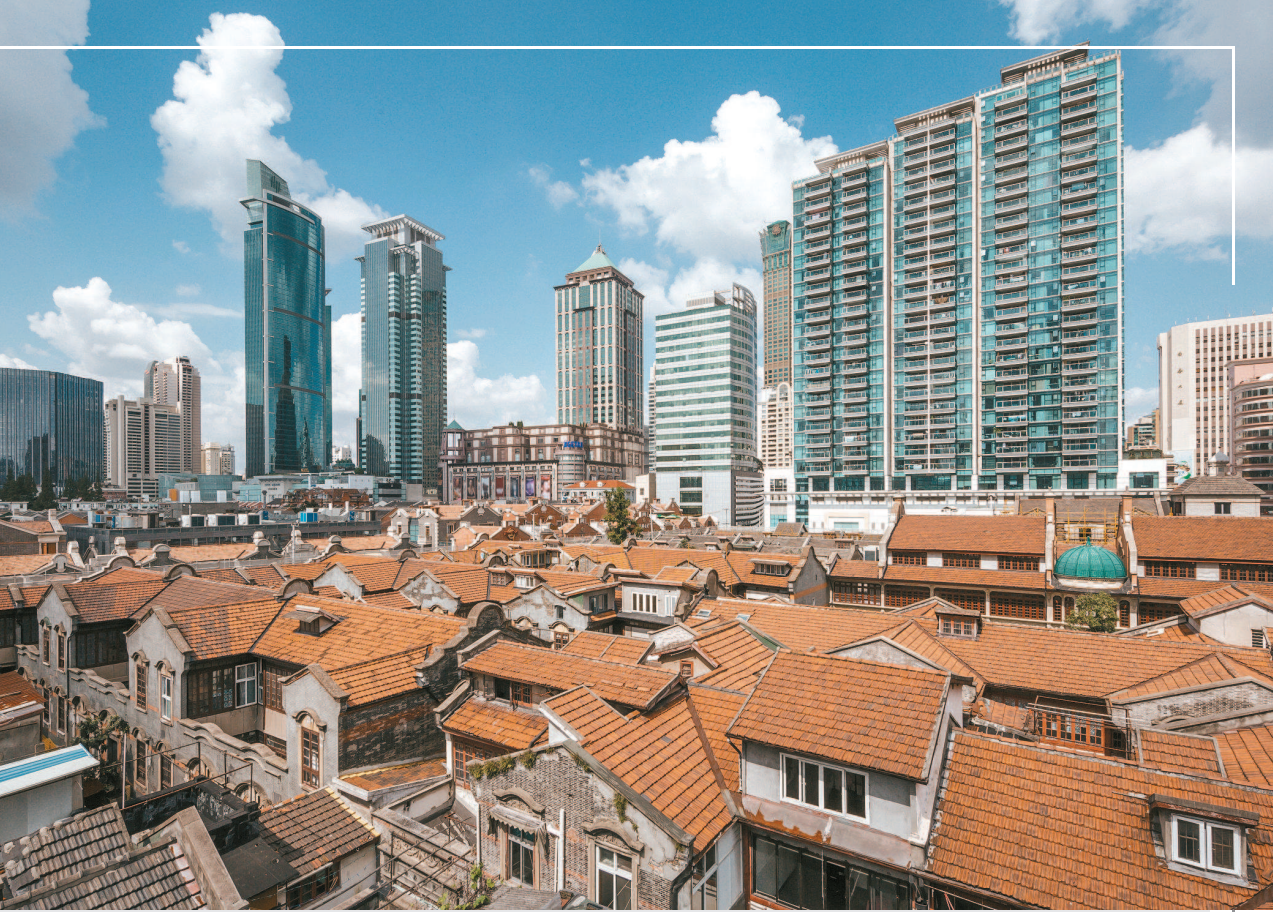
▲ 张园叠加了经营性私园、石库门里弄、里弄公馆与花园巨厦等多重历史遗迹，因为张园俯瞰 ▲ 1893年地标建筑“安垲第”的建成令张园在上海声名大噪，因为早期张园“安垲第”明信片

张园区域的细分地块形状大小各不相同，开发的住宅产品也异常丰富。尺度上来说，从单开间到五开间都有。风格上