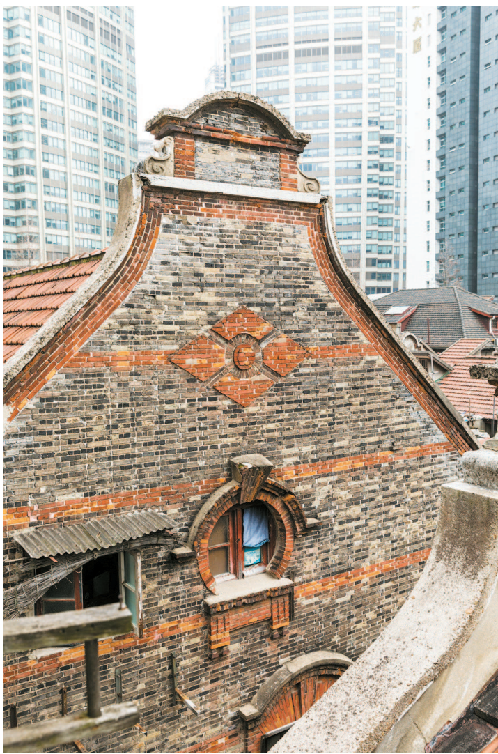
▲ 张园带有巴洛克风格的山墙