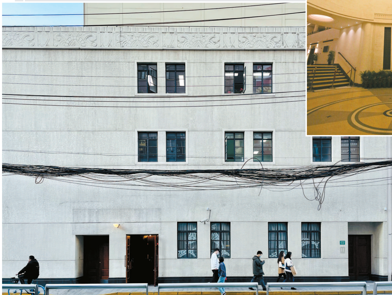
▼沿街展开的矩形体量，立面上点缀着几组面积不大的小窗，几何构图十分舒服，体积感十足。建筑檐部和窗户的装饰图案可以看到中国传统建筑的语言特点。

▼美琪大戏院坐落于两条街道相交处，街角的圆柱形体量、圆柱体两侧的矩形体量及其简洁立面，使其在所处街区中极具识别性。建筑的主要入口即位于圆柱形体量，圆柱体开启竖向长窗，长窗宽度与窗间墙的宽度相仿，两者交叉分隔形成垂直线条，长窗与窗间墙通过收分的线脚进行交接，弱化了圆柱体的实体感，增加了通透感。