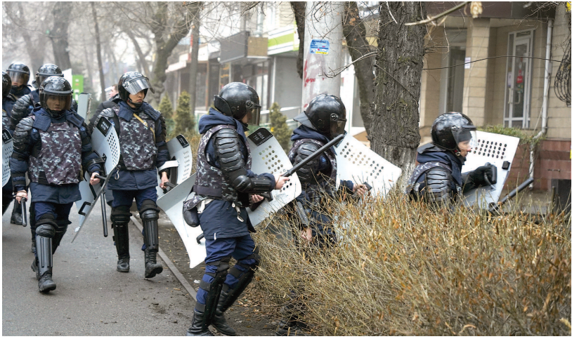
5日,阿拉木图,防暴警察在抗议活动中维持秩序。

据哈通社报道,1月5日,哈萨克斯坦总统托卡耶夫接受了总理马明的辞职申请,并签署了关于解散哈萨克斯坦共和国政府的总统令。总统令即日起生效,由第一副总理迈达列夫代理总理之职,其他政府成员继续履职,直至新内阁产生。 新年伊始,哈萨克斯坦西部曼吉斯套州取消了天然气价格上限,导致气价飙升,引发民众不满。扎瑙津市民要求政府降低天然气价格,1月2日抗议者开始在市府大楼前集会,警察封锁了现场但未进行干预。市政府称集会未得到批准,属于非法行为。但随后几天抗议人数不断增加,且得到其他城市响应,逐渐从哈萨克斯坦西部向中、东部地区发展。首都努尔苏丹和哈最大城市阿拉木图也未能幸免,相继爆发了抗议集会。