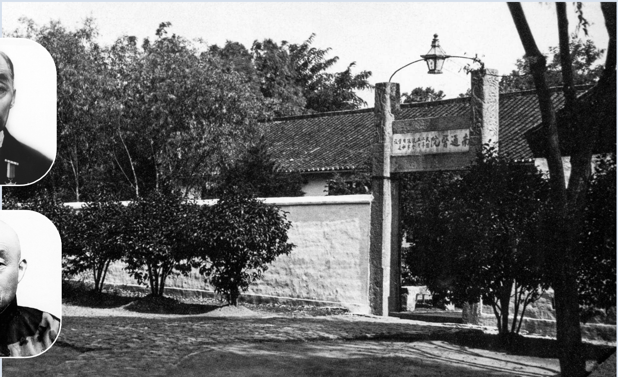
图为张謇(上)与张謇兄弟创办的南通医院