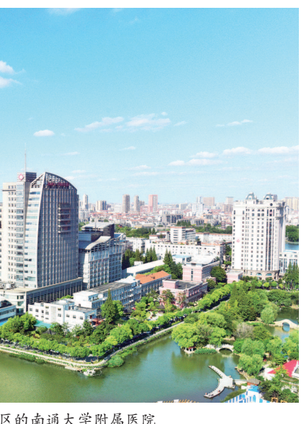
图为坐落在濠河风景区的南通大学附属医院

康爱石是第十七届中国戏剧梅花奖得主,这是他又一次在话剧舞台上饰演张謇一角。早在2017年,南通艺术剧院就创作了话剧《张謇》,该剧制作人、副导演杨晶即邀请康爱石主演张謇。此番排演《通医魂》,杨晶坚持非康爱石不出演张謇不可:“康老师是话剧舞台上饰演张謇的不二人选。”话剧《通医魂》总策划人、南通大学附属医院党委常务副书记马卫东激动地发现,康爱石竟然是电视剧《平凡的世界》中田福堂的表演者,对于康爱石塑造的张謇,张謇的后人也极为认可,南通的观众更因爱戴张謇而“爱屋及乌”地敬重在台上扮演张謇的康爱石。康爱石爱好垂钓,渔场主原先对他并不热情,但看过话剧《张謇》之后竟视之为挚友,不仅坚决拒收垂钓费,还每每都亲捞大鱼让康爱石满载而归。三年间演了70余场