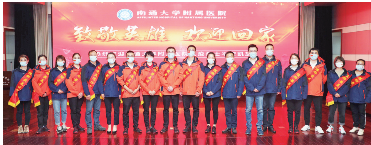
图为南通大学附属医院18名援鄂队员平安凯旋

人的砥砺前行和接续奋斗。”创办伊始,张謇、张謇就确定了医院与医校相互孳乳、齐头并进的先进理念。正是他们前瞻性的眼光,医院的百年发展始终将医疗实践与教学相结合,临床专家和医学教授的双重身份得以融合相通,也因此涌现了一代代名医和名师。南通大学附属医院党委副书记、院长施伟认为:“传承和弘扬张謇精神,厚植独特的医院文化,继往开来,再创辉煌,用优异的成绩向110周年院庆献礼,是我们当代通大附院人的使命与责任。”张謇先生的爱国热忱、为民情怀、开放理念、无畏勇气、创新意识、担当意识、实干品质、诚信品格,在通大附院人的血脉中生生不息、代代相传,也在这一台话剧《通医魂》中有了立体的呈现。