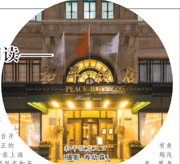
和平饭店入口 有鱼翔浅底,置身其中,恍然水晶世界。现在或许很少有人知道这种玻璃了,然而在20世纪初,它风行一时。这是一种珍贵的特种玻璃艺术品,在烧制过程中熔入锡、砷和铅,有透明和磨砂两种,具有特殊的色彩及立体效果,远看是乳白色,近看是暗蓝色,迎着光则呈鲜红色,犹如一团火。其创始人是在1925年巴黎国际装饰与工业艺术博览会上赢得轰动性声誉的法国人雷内-拉利克。如今,拉利克艺术玻璃已成珍贵文物。和平饭店特在8楼设置“拉利克廊”,以作展示。

在和平饭店的几个餐厅和会客室里,镶嵌着若干平方尺的拉利克艺术玻璃作品。有花鸟屏凤,有飞鹤展翅,还