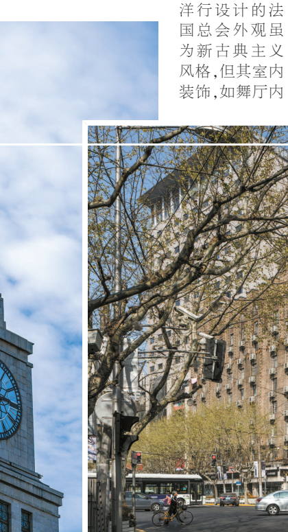
Art Deco 在建筑外观上的表现,是从1927年建成的海关大楼开始的,它顶部层层收进的立方体钟塔所表现出的体积感和高耸感明显露出 Art Deco 格调。1928年建成的德义大楼,其立面造型已完全是 Art Deco 风格。左图为海关大楼,上图为德义大楼

除物质层面的影响外,Art Deco 还传播了一种新的生活方式、一种新的美学思维及价值观。在结合新的建筑类型方面,Art Deco 更多地与新式高层公寓、办公楼结合。而现代的生活设施,明亮宽敞的空间、摩天楼的高度无疑造就了一个梦幻世界。对彼时的普通市民来说,原有的观念受到巨大冲击,Art Deco 同“摩登”“异域”“高尚生活”等联系起来,成为人们向往的场景。因而,就上海不同的地段街区而言就拥有了不同的意义。