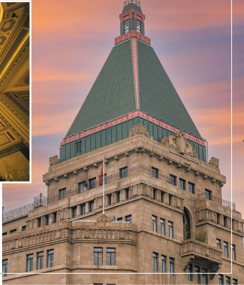
1929年,黄浦江畔有着绿屋顶的沙逊大厦(今天的和平饭店)落成,标志着上海建筑开始全面走向 Art Deco 时期。上图为和平饭店内景,右图为和平饭店外景