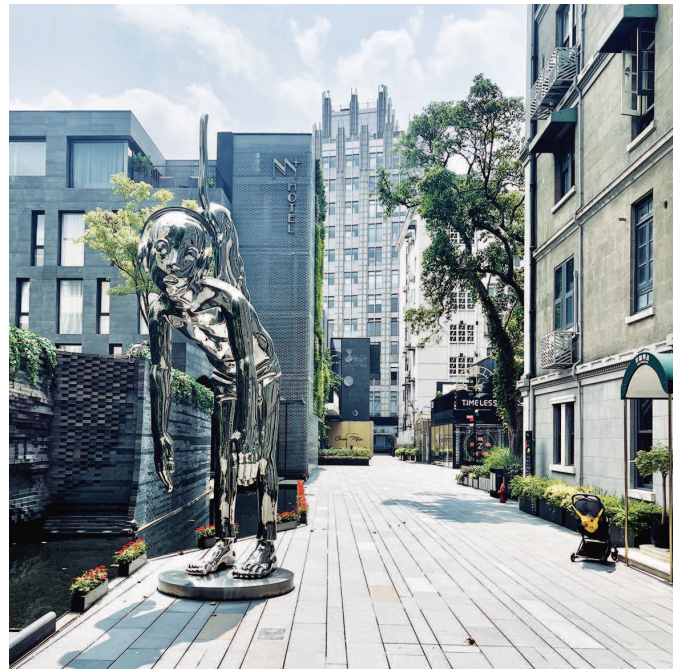
▲ 今天的黑石公寓外景