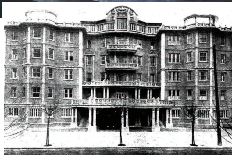
▲ 黑石公寓历史照片