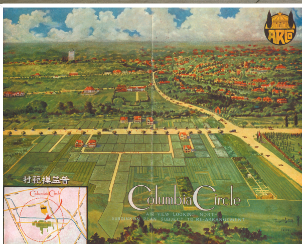
曾经的哥伦比亚圈规划鸟瞰图,加拿大维多利亚大学鄂达克档案

在哥伦比亚圈住宅规划中,鄂达克与普益地产把基地分成了70余个长方形地块,每个地块上建设风格各异的花园洋房,而1929年第一批落成的洋房里包括了西班牙风格、意大利风格以及英国风格