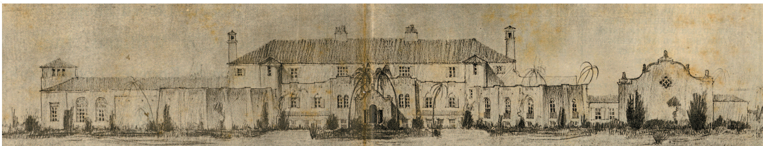
《密勒式评论报》所刊载的哥伦比亚乡村总会立面方案图