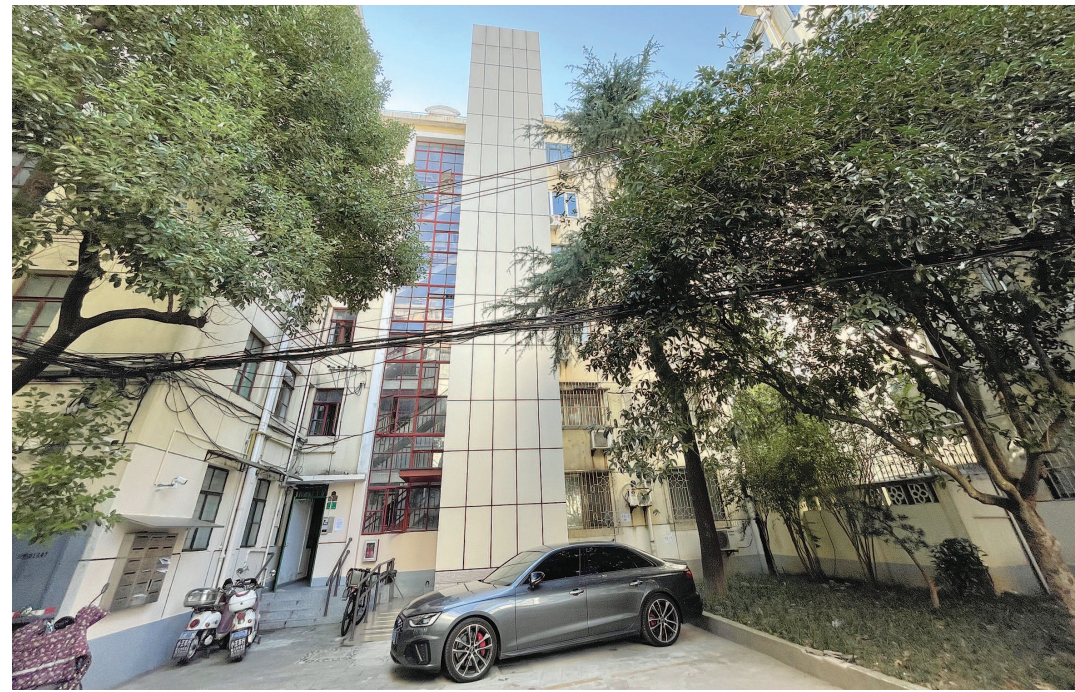
高安路50弄小区即将成为衡复风貌区内首个实现“整建制”加梯的老旧小区。

各是保护建筑黑石公寓、克莱门公寓。复兴中路1333弄小区，就这样被困于历史保护建筑围合成的风貌保护街区之中。