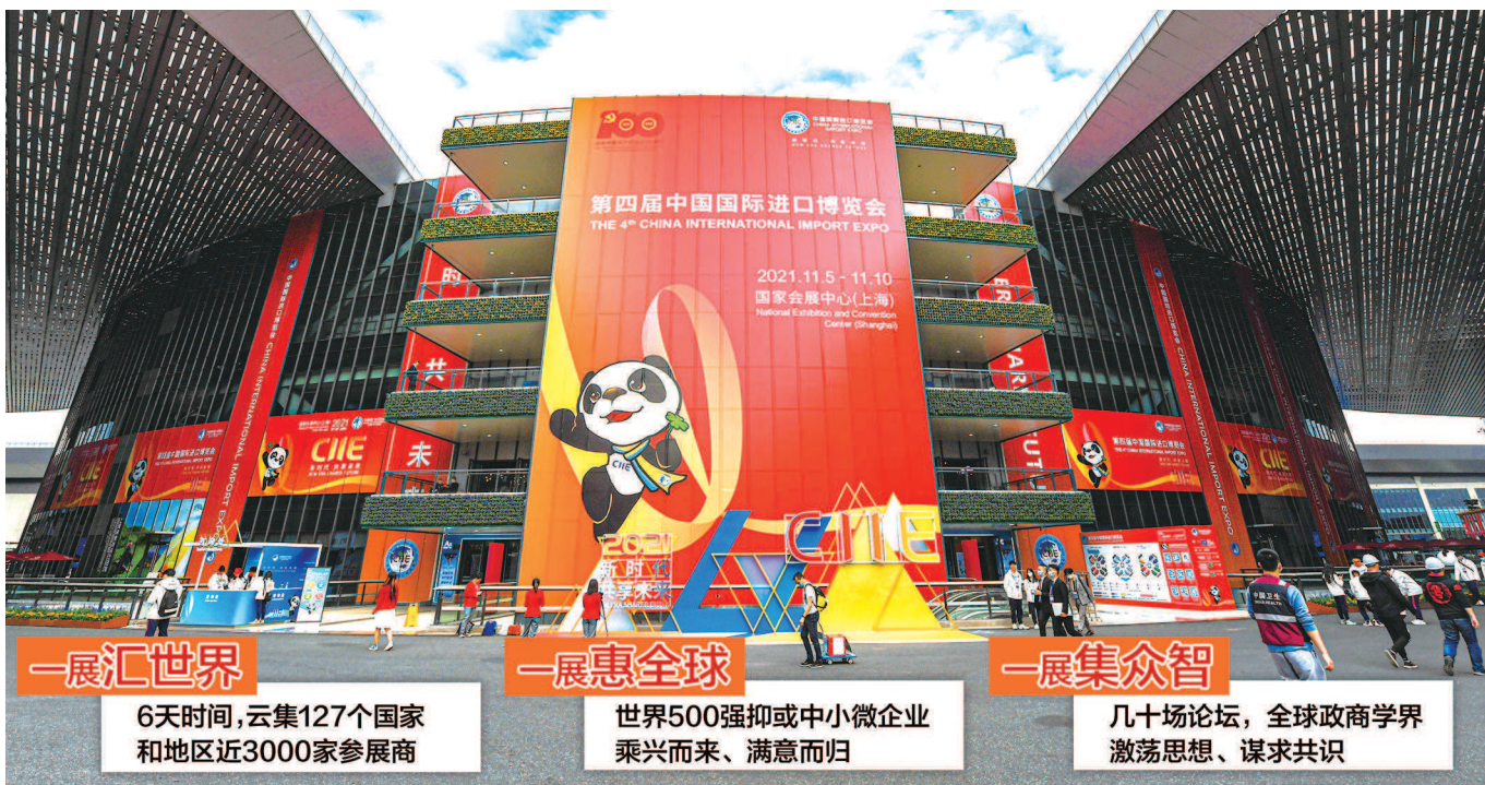
6天时间,云集127个国家和地区近3000家参展商 世界500强抑或中小微企业乘兴而来、满意而归 几十场论坛,全球政商学界激荡思想、谋求共识