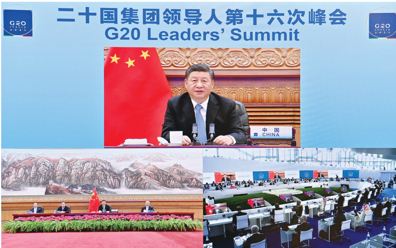
10月31日晚,国家主席习近平在北京继续以视频方式出席二十国集团领导人第十六次峰会。