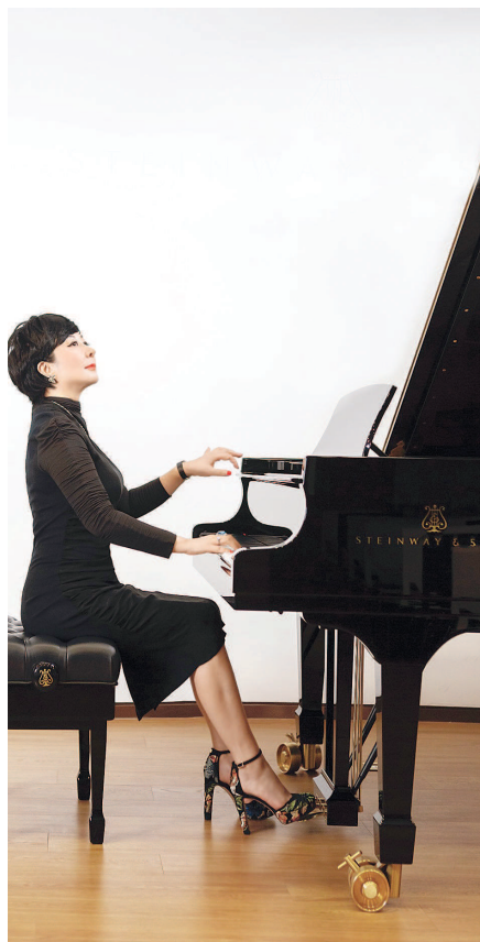
加拿大籍作家贝拉“幸存者之歌音乐会”将于11月13日晚在上海音乐厅举办。

这场音乐会上所有曲目均来源于世界名曲和犹太民谣，展现了犹太人的智慧以及贝拉所著长篇小说《幸存者之歌》主人公迈克一家在上海时的经历，他们在异国他乡靠着爱与信仰的力量，拥有了精彩人生；更呈现了作家贝拉的故乡上海是一座海纳百川的城市——上海人与犹太人在人类历史上谱写了包容友爱与国际大爱的难忘篇章。