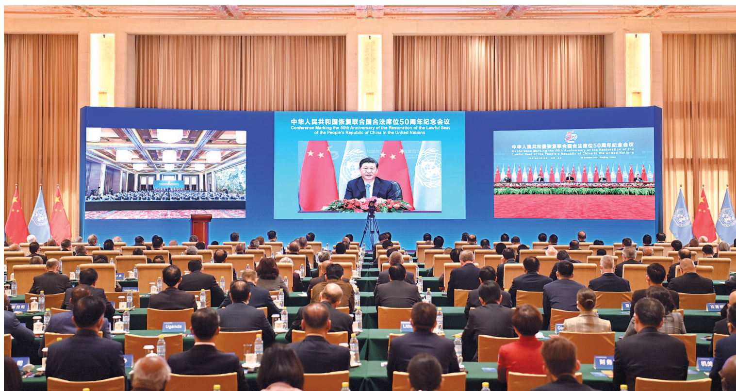
10月25日,国家主席习近平在北京出席中华人民共和国恢复联合国合法席位50周年纪念会议并发表重要讲话。