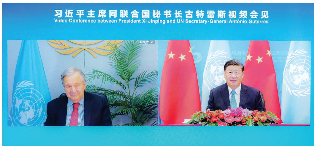
10月25日上午,习近平在北京人民大会堂以视频方式会见古特雷斯。

强调世界上只有一个体系一个秩序一套规则,任何国家都应该在这个框架内行事,不能自行其是另搞一套 王沪宁参加会见