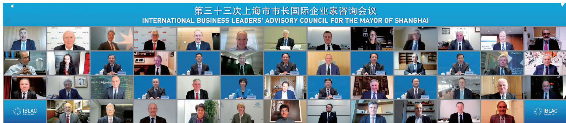
第三十三次上海市市长国际企业家咨询会议全家福。

本报讯 集世界智慧、助上海发展。第三十三次上海市市长国际企业家咨询会议10月15日晚举行视频会议。上海市委书记李强,市委副书记、市长龚正与来自全球22个城市的40位国际企业家“云端”畅谈,围绕“新发展格局与上海改革开放引领角色”这一主题,听取国际企业家的真知灼见,推动上海与国际企业家深化合作,携手应对风险挑战,共同促进繁荣发展。