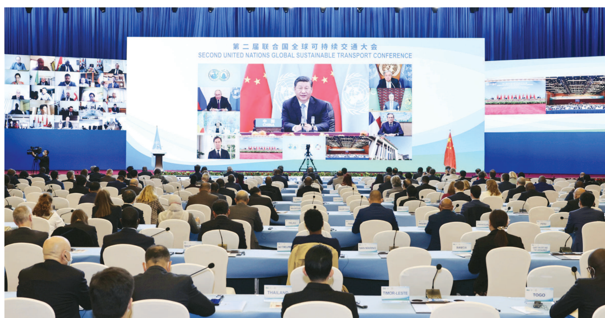
习近平以视频方式出席第二届联合国全球可持续交通大会开幕式并发表题为《与世界相交 与时代相通 在可持续发展道路上阔步前行》的主旨讲话。

新华社北京10月14日电 国家主席习近平14日晚以视频方式出席第二届联合国全球可持续交通大会开幕式并发表题为《与世界相交 与时代相通 在可持续发展道路上阔步前行》的主旨讲话。(讲话全文另发)