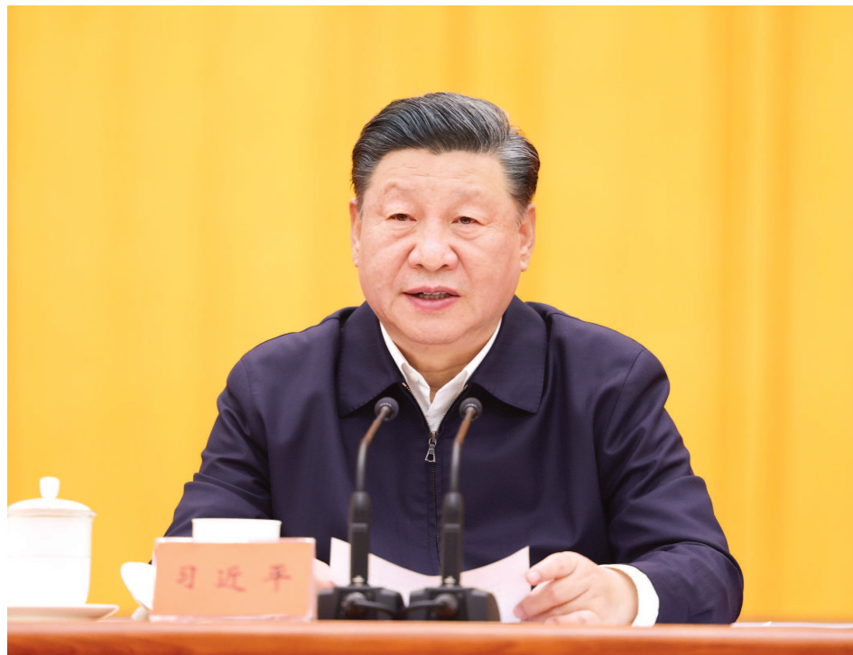
10月13日至14日，中央人大工作会议在北京召开。中共中央总书记、国家主席、中央军委主席习近平出席会议并发表重要讲话。

我国全过程人民民主不仅有完整的制度程序，而且有完整的参与实践。我国全过程人民民主实现了过程民主和成果民主、程序民主和实质民主、直接民主和间接民主、人民民主和国家意志相统一，是全链条、全方位、全覆盖的民主，是最广泛、最真实、最管用的社会主义民主。我们要继续推进全过程人民民主建设，把人民当家作主具体地、现实地体现到党治国理政的政策措施上来，具体地、现实地体现到党和国家机关各个方面各个层级工作上来，具体地、现实地体现到实现人民对美好生活向往的工作上来