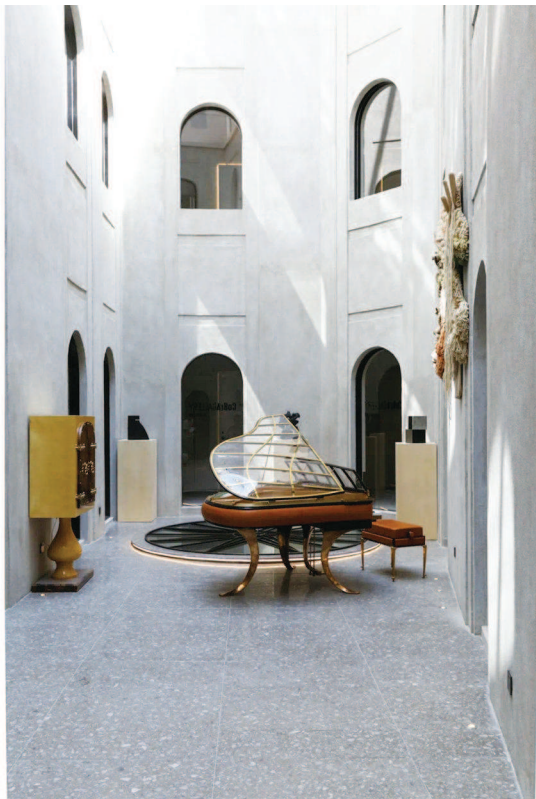
▲眼镜蛇画廊。▶MAKI Gallery 东京空间。制图：李洁

去年，正是由这两大艺博会领衔的第二届上海国际艺术品交易月，在全球各地众多艺事因疫情而纷纷被按下“暂停键”之时逆势火力全开，擎起申城千亿级艺术品交易市场蓝图，也为全球艺场注入一针强心剂。今年，从两大艺博会率先透出的信息中，人们已经可以对新一届交易月抱以无限期待。届时，它们将与上海各大美术馆、画廊和艺术机构合力共绘再度备受全球瞩目的申城艺术版图。