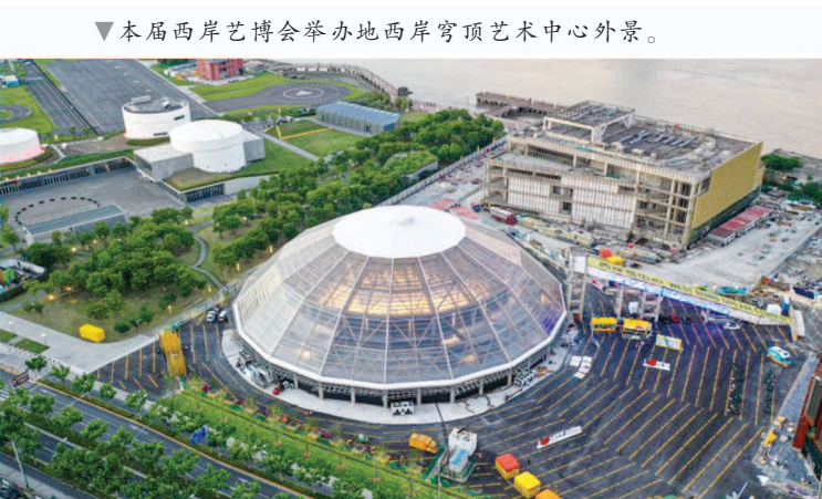
▼本届西岸艺博会举办地西岸穹顶艺术中心外景。