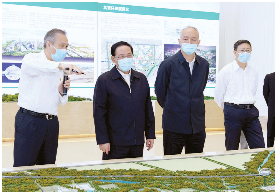
上海市代表团在北京考察学习,图为听取北京城市副中心规划建设情况介绍。

本报讯 为进一步推动上海与北京友好合作交流,更好携手服务国家发展大局,上海市代表团昨天在北京考察学习首都改革开放、创新发展和城市建设的宝贵经验,实地感悟首善之地奋发有为的昂扬精神,共商两地深化合作大计。上海市委书记李强与北京市委书记蔡奇,北京市委副书记、市长陈吉宁举行北京市·上海市工作交流座谈会。 作为我国第一个国家级自主创新示范区,中关村国家自主创新示范区在制度创新上大胆试、大胆闯,科技创新不断跑出加速度,实现新飞跃,正在加快建设世界领先的科技园区。上海市代表团在展示中心听取中关村发展历程和科技成果转化应用情况介绍,围绕发挥科技体制改革试验田作用、打造独具特色的创新创业生态体系作了具体了解。李强说,这次来京考察,就是要更好对标北京,学习北京,更好担当落实党中央赋予上海的使命任务,加快建设具有世界影响力的社会主义现代化国际大都市。代表团一行就中关村运行体制机制和搭建平台服务科研院所、创新企业的探索实践等,与北京同志深入交流。大家表示,北京、上海都在按照中央要求加快推进科技创新中心建设,都承担着高水平科技自立自强的战略使命,我们要深入学习借鉴中关村形成的改革创新经验做法,结合上海科技创新实际,进一步强化科技创