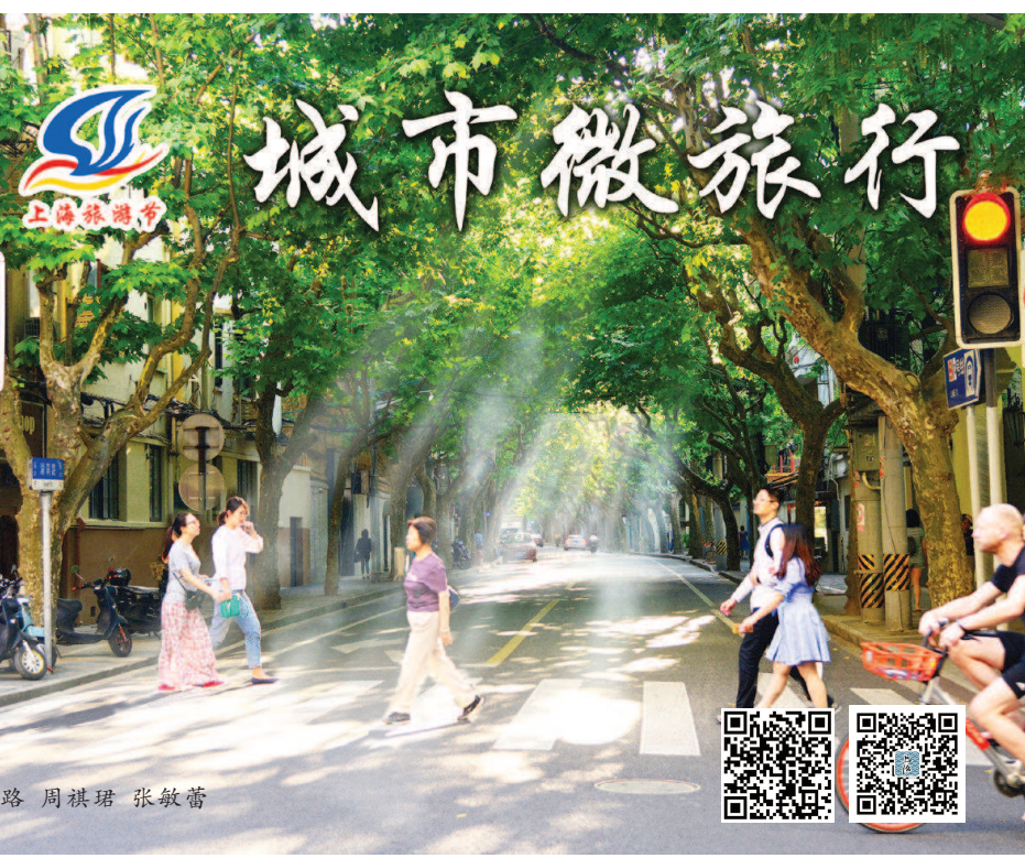
文/王路 周祺琪 张敬蕾

每一个人对她的独家记忆,幻化成了独一无二的那条路。”这才知道,第四维的淮海路,在记忆里,在成长里,在追寻中,在爱里。