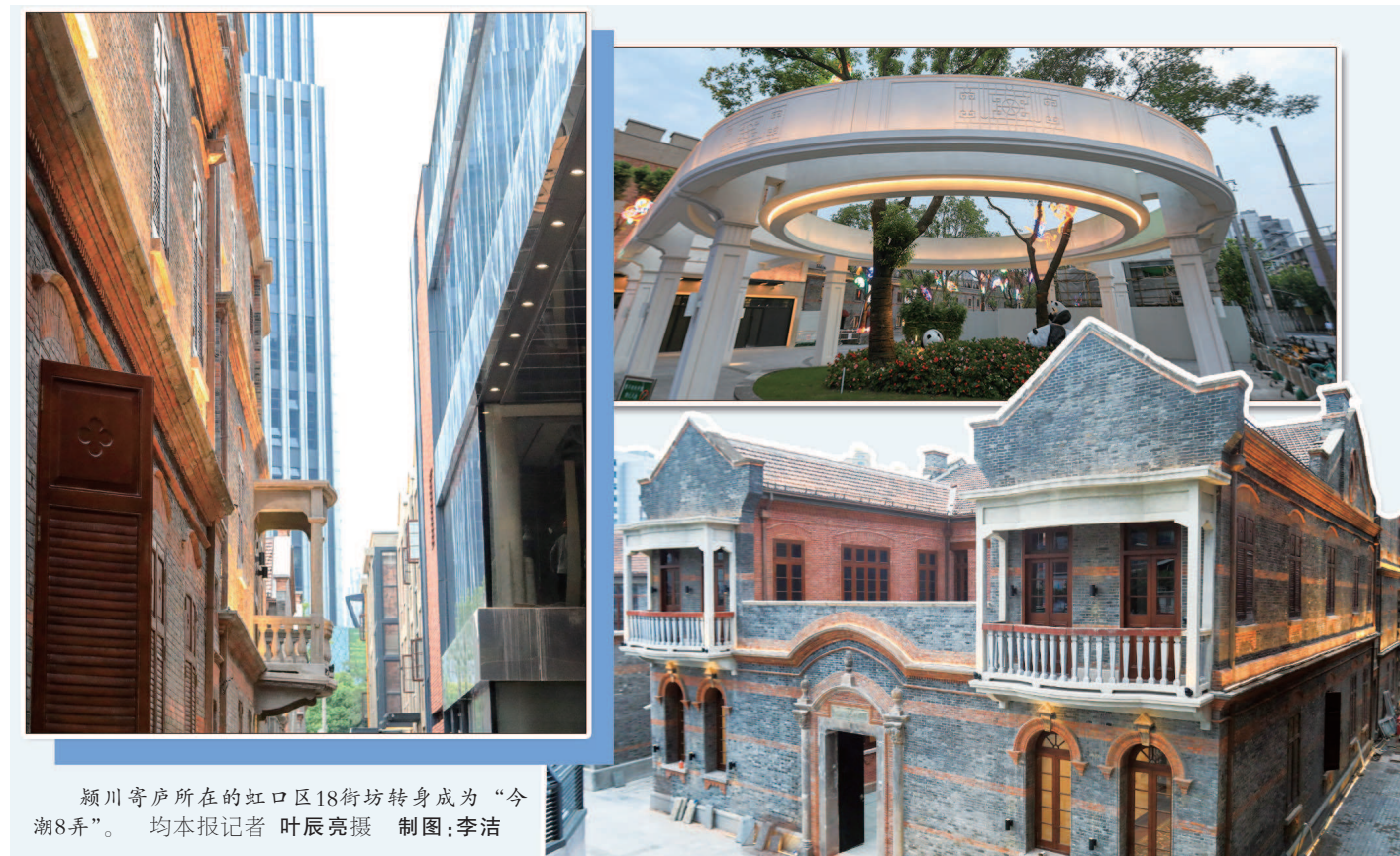
颍川寄庐所在的虹口区18街坊转身成为“今朝8弄”。 制图：李洁

小到装饰物原色，大到房屋结构，修缮18街坊的工人师傅都尽可能根据史料复原细节。相关负责人说，首先要保护建筑肌理，才能把建筑和建筑里的故事留下来。18街坊老建筑的修缮团队曾参与沪上多个历史文化风貌街区的商业体开发项目。“今朝8弄”力求在重现街区风采同时，形成海派文化赋能新商业的模式，打造沉浸式文化艺术体验场地，提升区域人文氛围。