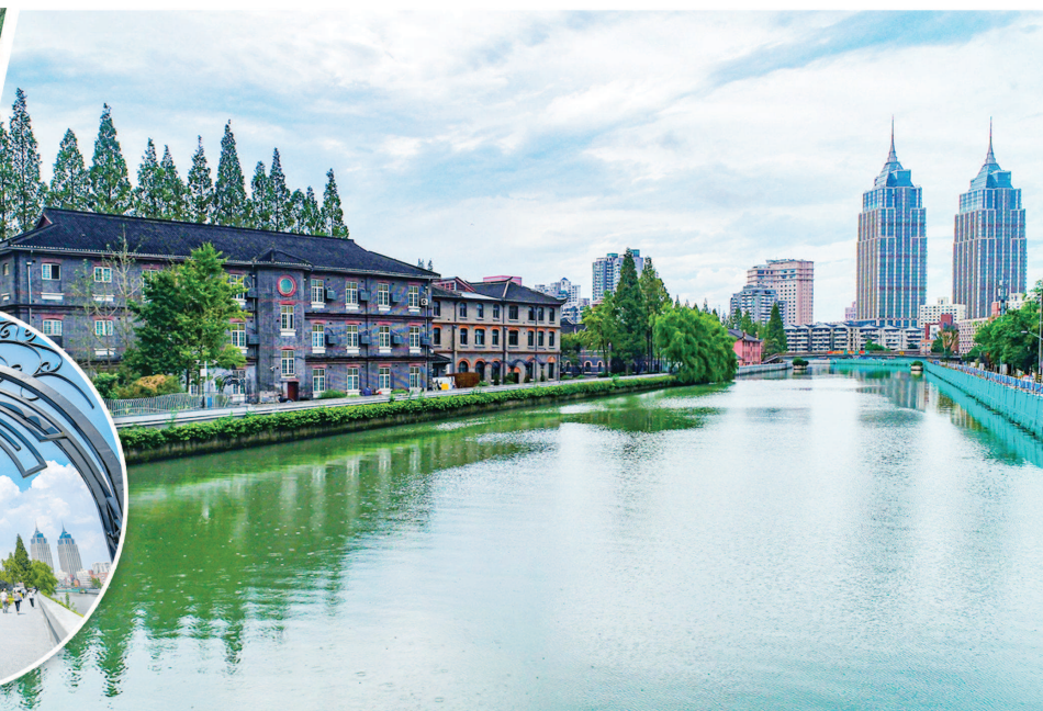
制图:冯晓瑜