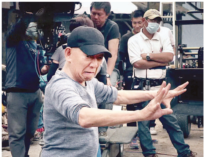
纪录片《龙虎武者》海报。

武行中，成为成龙、甄子丹这样的功夫巨星毕竟凤毛麟角，多数人从少年时甚至孩提时开始习武，几十年严格训练，只在银幕上留下一个个背影抑或片尾一闪而过的名字。但是这群人十年磨一剑苦练练武、满腔热血付出，在经历岁月的沉淀后，成就了香港功夫片、香港电影的气质和精神。