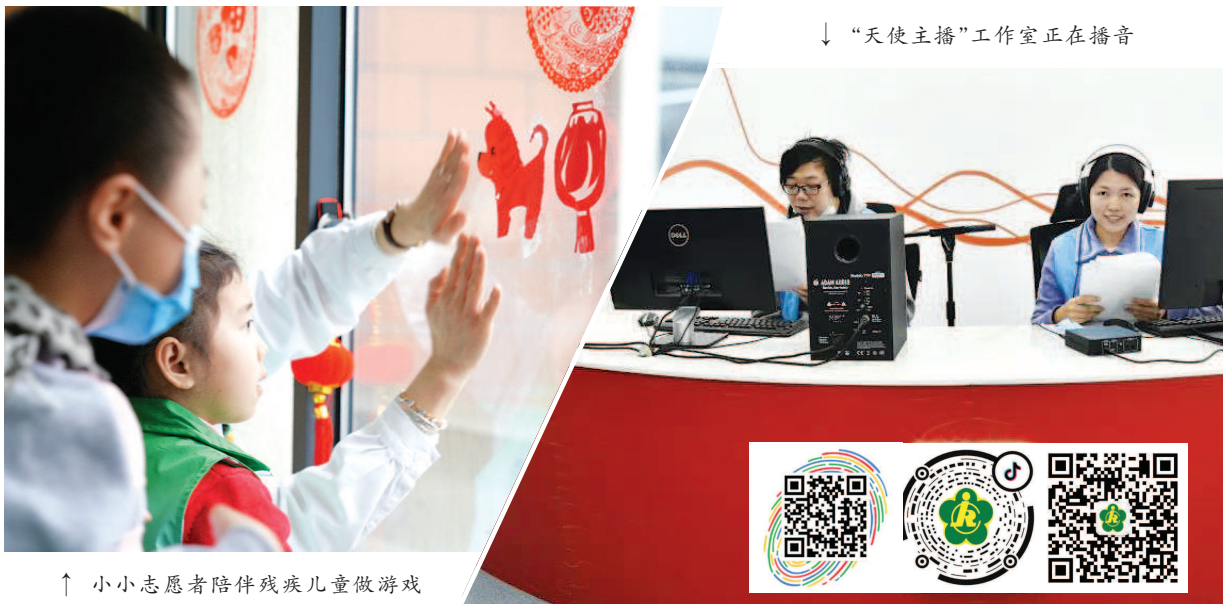
↑ 小小志愿者陪伴残疾儿童做游戏

在浦东新区残疾人阳光职业康复援助基地，除了咖啡培训，靠声音也能实现就业。2018年，浦东新区残联打造