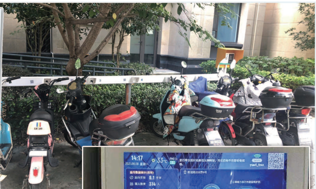
▲彭浦镇联合物业、业委会在小区新增、改造一批非机动车停车位,并配置充电桩和消防安全设施。