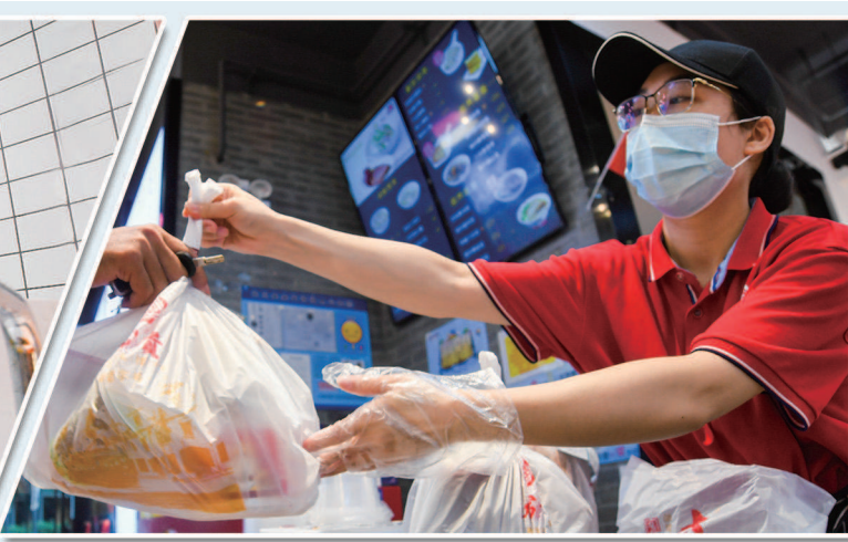
▲ 临平路瑞虹坊内的大富贵店员正将早餐打包递给外卖小哥。 ▲ 长宁区熙香虹桥社区AI食堂内,无人面档区采用机械化生产,可自动完成取面、烹饪、加汤、出餐的流程。