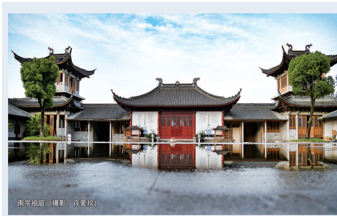
南宗祖庭

“和合学”架起了理论框架。对和合理论研究最有高度、最有深度的人之一，是中国人民大学人文学院哲学