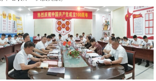
镇广大干部群众对祖国的祝福,也表达了党员干部牢记使命的决心。镇党委领导希望全镇党员干部能够齐心协力、锐意进取,为建设华新商贸服务枢纽城镇发展贡献力量。华新镇相关领导为那些在党的事业和经济社会发展方面作出的贡献的干部群众进行颁奖。

场党员12条标准,即“三亮、三定、三促、三有”;开展了市场经营户党员的“三亮”活动,即亮身份、亮形象、亮承诺,党员自身做表率;开展了区域化党建党员包干责任制,红色引领覆盖全市场,提升了发展经济新动力,提升了营商环境新形象。全体党员通过政治理论学习与实际相结合,在新时代有新思想、有新作风、有新作为,争做具有政治性、群众性、先进性的合格共产党员。 同时,党支部重视党建工作宣传,利用重要讲话学习等宣传工具加深党员认知,并通过建设市场党群展示活动中心,以及开展主题党日等活动等形式,不断增强党员、爱国、爱中国特色社会主义道路的信念与信心,将党支部建设成为宣传党的主张、贯彻党的决定、领导基层治理、团结动员群众、推动市场发展的坚强战斗堡垒。 携手共进,服务市场发展 党支部带领工青妇等