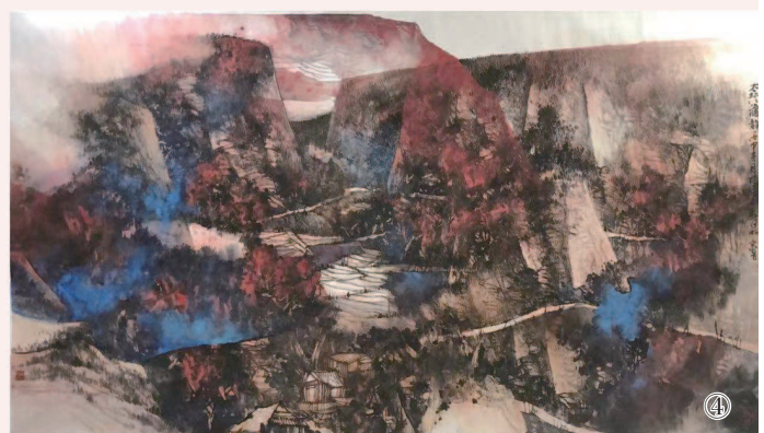
①方增先创作于1955年的《粒粒皆辛苦》，中华艺术宫展品。 ②陆俨少、唐云、伍蠡甫、张守成等创作于1965年的《新安江》，程十发美术馆展品。 ③华三川《永不消逝的电波》，一百零八上苑展品。 ④汪家芳《太行秋韵》，陆俨少艺术院展品。