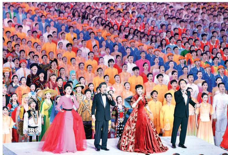
歌唱家廖昌永、魏松、殷秀梅、么红登台领唱,带领全场演出嘉宾共同合唱主题曲《领航》。

“伟大的中国共产党,风华正茂,山高水长,昂首挺立在新世纪的征程上……”为了唱响《领航》,著名男高音歌唱家、上海歌剧院艺术总监魏松在北京待了整整21天,与演员们磨合排练奉献出最真挚动情的歌声。在鸟巢里和几万人一起唱响《领航》,他说自己“特别幸运”,“我们赶上了百年一遇的时刻。”魏松说,当晚从主要表演嘉宾到上万人的合唱队,“好多人边唱边流下了眼泪,因为歌曲唱出了我们对祖国的心声和对党的深情”。这首全新创作的歌曲温暖、深情、高昂而震撼,情绪变化层层递进,同时旋律朗朗上口、好好好记,“这首歌不火都不行!”