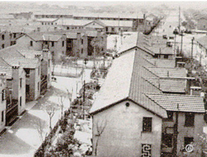
影像百年·城市荣光