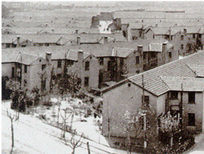
1949年10月2日,上海市人民政府大厦升起五星红旗。2小提琴协奏曲《梁祝》首次公演。3市民将积蓄的黄金白银兑换成人民币支援国家建设。4新中国成立后上海兴建的首个工人新村——曹杨新村。