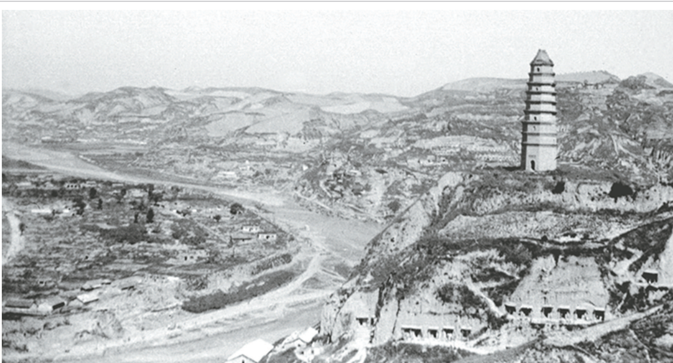
巍巍宝塔，滔滔延河——延安，革命圣地。延安时期是中国共产党领导的中国革命事业从低潮走向高潮、实现历史性转折的时期