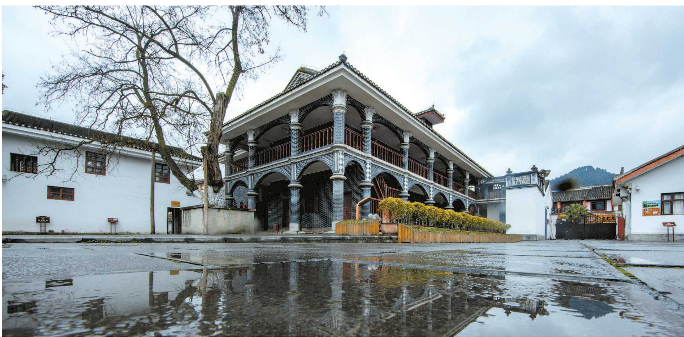
1935年1月召开的遵义会议，确立了毛泽东同志在党中央和红军的领导地位，在极端危急的关头挽救了党，挽救了红军，挽救了中国革命