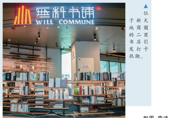
▲位于新天地的二酉书店打卡热潮。