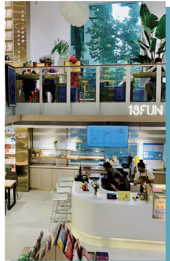
▲修葺一新的交大书院，正是沪上高校书店融入周边社区的生动缩影。

因建筑设计美图“刷屏”的二酉书店，营造出传统园林气氛，借花草把不起眼的角落布置成微型景观，并将酒、茶、书自然地结合起来，为阅读添了几分意趣和创意。比如，《诗经》可搭龙井；《牡丹亭》值得搭一泡上好的白牡丹；读《狂人日记》不妨佐酒，配小碟茴香豆；若读《老人与海》，来杯苏格兰单一麦芽威士忌；看日本《浮世绘里的女人们》，冰镇清酒倒是夏日应景选项。