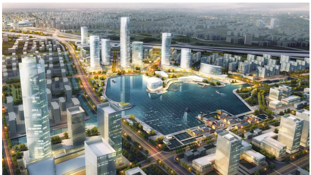
上海科技影都效果图。

从诞生之日起，上海科技影都便着眼“科创芯”“世界窗”双核发展理念，加速数字化转型，增强产业链、创新链、价值链韧性，强化影视产业的科技赋能。“水下飞天舞”的出圈只是一个案例，昨天，一批新项目揭晓，包含四个高科技影棚和一个水下数字摄影棚的吴淞影视基地揭牌启用，华策版权交易平台、国研智库创新科学园定军山影视数字科创基地项目、启名科技影视基地、上海科技影都影视衍生品开发基地等。