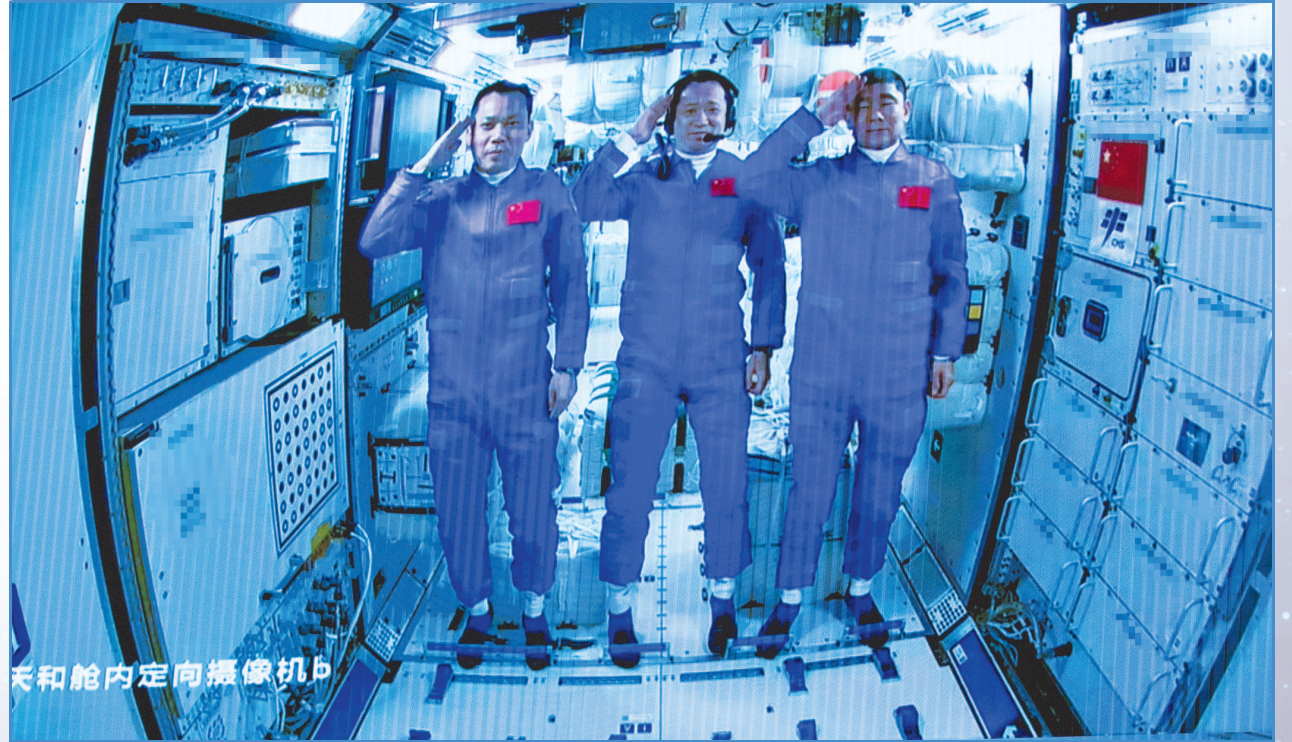
天和舱内定向摄像机

■这是我国载人航天工程立项以来第19次飞行任务,也是我国空间站阶段的首次载人飞行任务。神舟十二号的成功发射,意味着我国第一座自主研发的空间站开始进入一个全新的篇章,开始验证解决有较大规模的、长期有人照料的空间应用问题