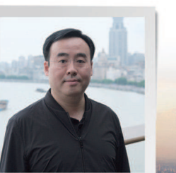
陈睿 哔哩哔哩董事长兼首席 执行官