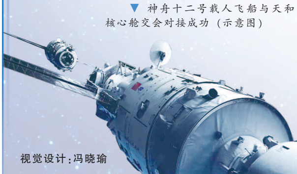
▼ 神舟十二号载人飞船与天和核心舱交会对接成功(示意图)