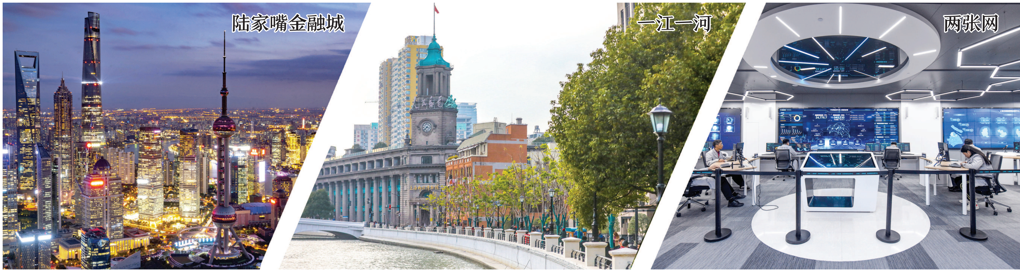
6000多家中外金融机构、30万金融从业人员在陆家嘴集聚。图为陆家嘴金融城夜景。

由中共中央对外联络部和中共上海市委共同主办的“中国共产党的故事——习近平新时代中国特色社会主义思想在上海的实践”特别对话会在上海举行。来自近100个国家、126个政党及友好组织的740多名代表通过视频连线参加对话会，40多个国家驻华大使现场出席会议。