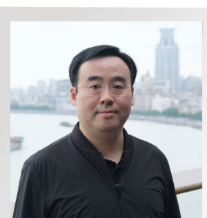
陈睿 哔哩哔哩董事长兼首席执行官