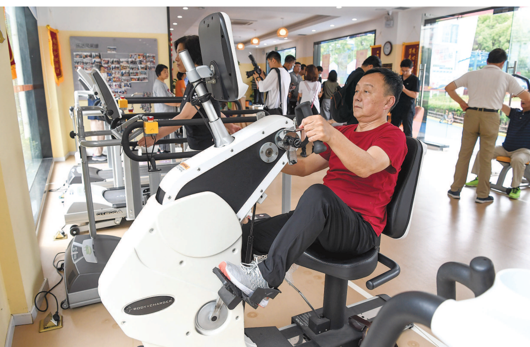
社区老年人在长者运动健康之家体验“一站式”运动康养服务。

在施宝民看来,长者运动健康之家是一项真正的惠民实事工程,“外面的私营健身房很贵,又不一定适合我们老年人。这里既符合我们的实际需求,又非常实惠。现在领了券后更加便宜,对