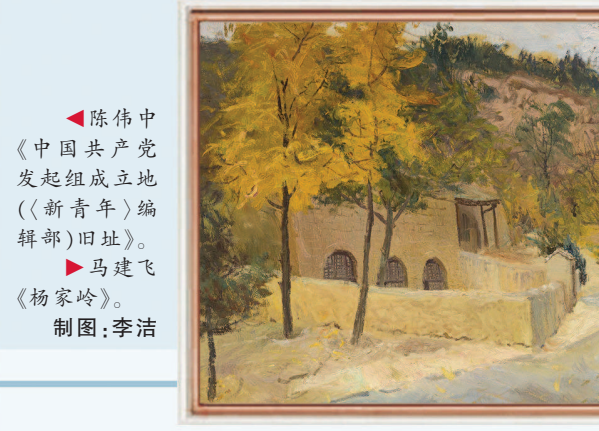
陈伟中 《中国共产党发起组成立地(《新青年》编辑部)旧址》。 马建飞 《杨家岭》。 制图:李洁