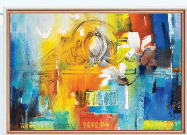
李光安 《中共二大会址》。