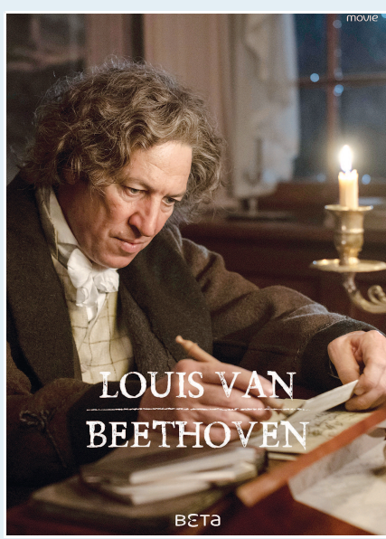
LOUIS VAN BEETHOVEN

“清水混凝土诗人”“没文化的日本鬼才”“疯狂的老板”……著名建筑师安藤忠雄身上有数不清的标签,虽然因病摘除了五个内脏器官,但他依然不屈不挠地活跃在建筑设计一线领域。明天将在纪实人文频道播出的纪录片《安藤忠雄:寄语