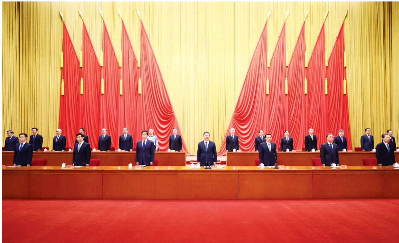
习近平、李克强、栗战书、汪洋、王沪宁、赵乐际、韩正等出席大会。