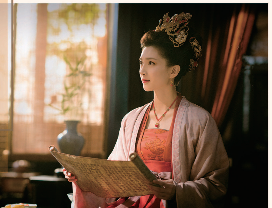
汉学家马克梦专著《天女临凡：从宋到清的后宫生活与帝国政事》。《清平乐》里的曹氏压抑憋屈，与正史中的形象出入颇大。