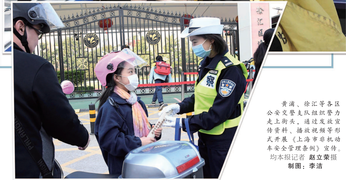
黄浦、徐汇等区公安交警支队组织警力走上街头,通过发放宣传资料、播放视频等形式开展《上海市非机动车安全管理条例》宣传。均本报记者 赵立荣摄 制图:李洁