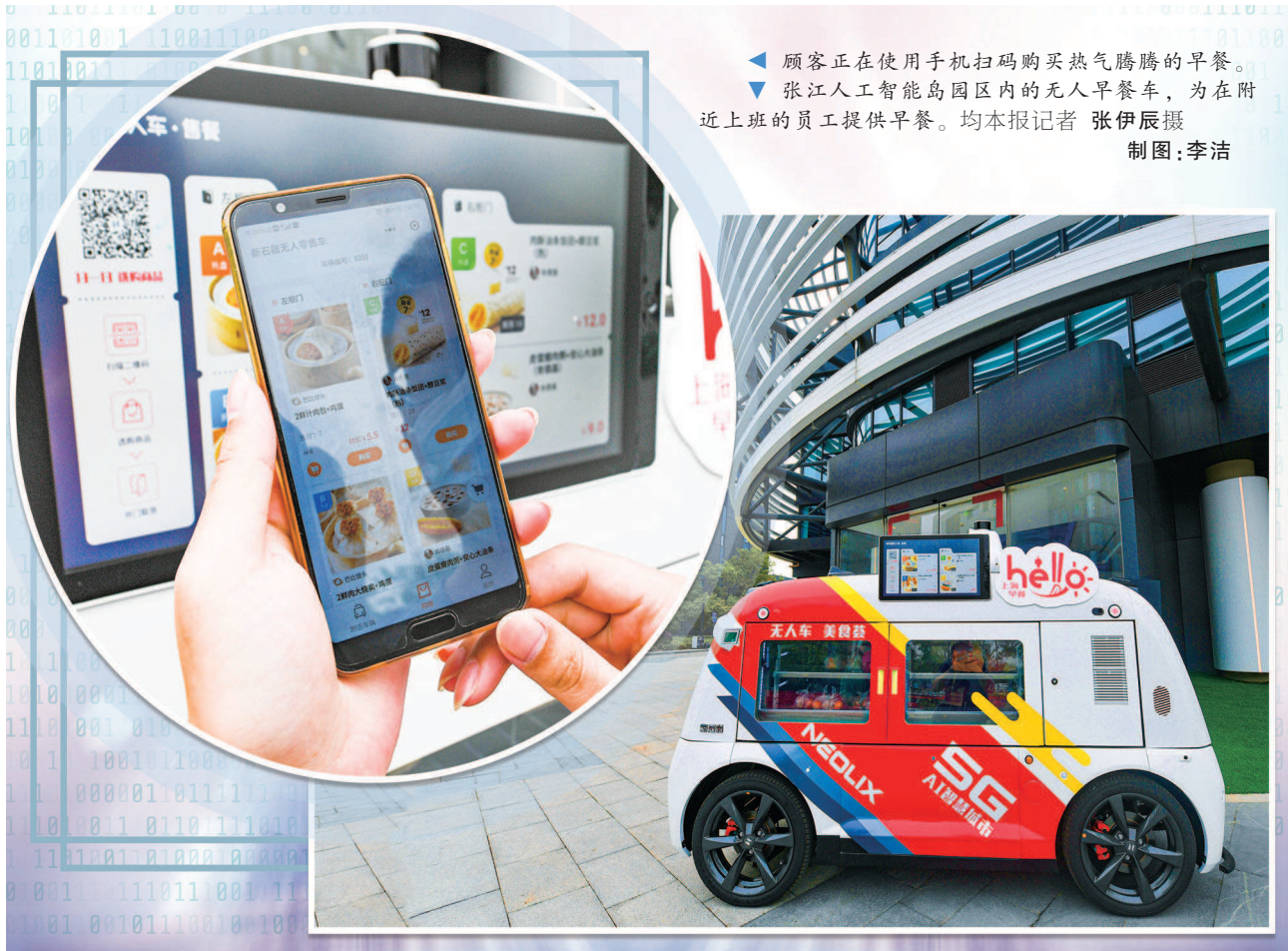
顾客正在使用手机扫码购买热气腾腾的早餐。 张江人工智能岛园区内的无人早餐车,为在附近上班的员工提供早餐。 制图:李洁