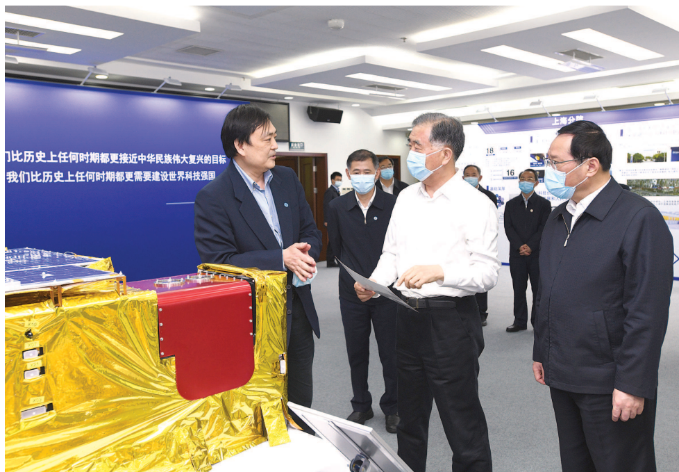
4月26日，汪洋在中国科学院上海分院了解项目研究成果。